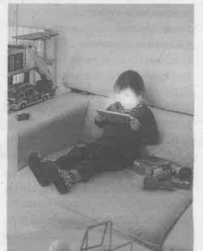
Un fragmento de una de las fotos.

En tal caso sería una autocrítica, porque retrato a los más próximos a mí. Estas imágenes forman parte de una serie más amplia, donde también hay adultos. Es un tema que me intriga, sobre todo en el caso de los menores. La comisaria escogió para la inauguración un texto donde uno de los creadores de Facebook reconocía que el colgar algo en internet y que le den al 'like' produce una adicción tan fuerte que su familia no es usuaria de las redes sociales. Es como crear un monstruo y luego no saber qué hacer con él. ■