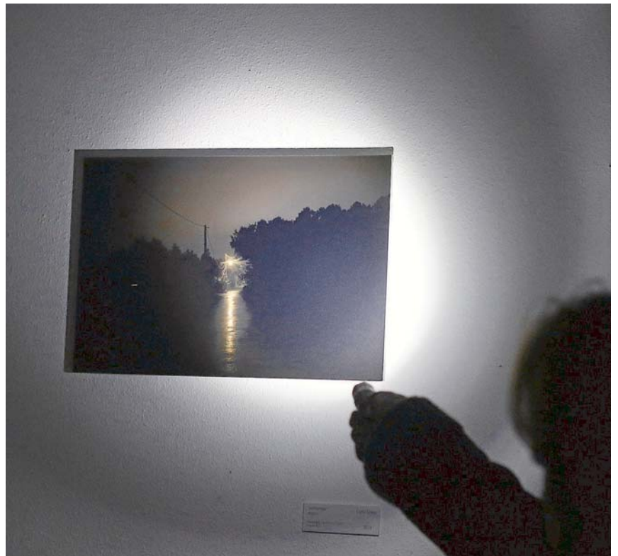
Punto Once invitó a los asistentes a compartir la sensación de fotografiar de noche, inaugurando a oscuras. J.V. LANDÍN

Sainza Trébor crea un escenario casi cinematográfico sugiriendo un asesinato, indicando el lugar y el hallazgo del cuerpo envuelto en una alfombra. Como complemen-