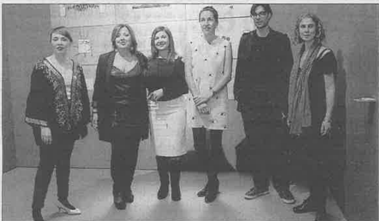
Los artistas de la exposición en Lab-In.